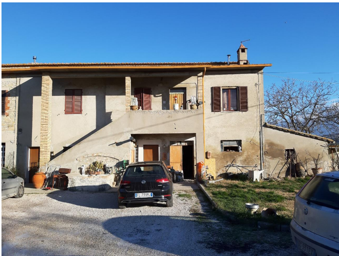
Foto 11- Prospetto sud